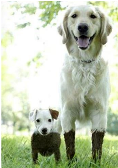
Hoe diep was de modder?